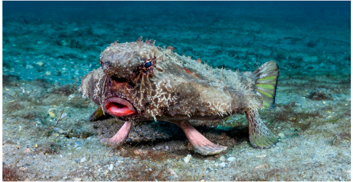
le poisson chauve-souris aux lèvres rouges