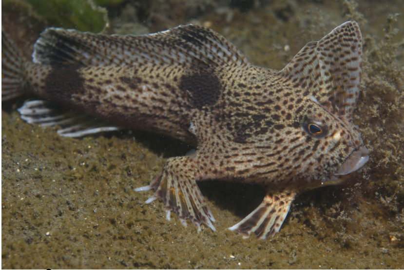
le poisson à mains