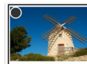
MOULIN A VENT