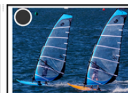
PLANCHE A VOILE