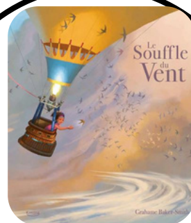
LE SOUFFLE DU VENT