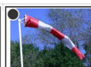
MANCHE A AIR