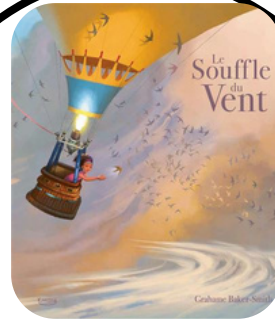
LE SOUFFLE DU VENT