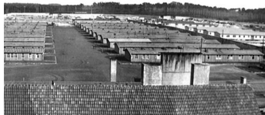
Photos prises au camp de Ravensbrück, en Allemagne