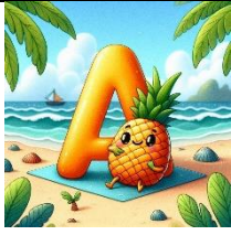
A de ananas