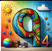
Q de quatre