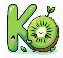
K de kiwi