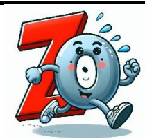
Z de zéro