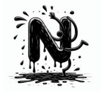
N de noir