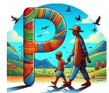
P de papa