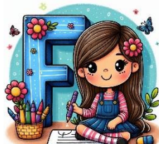
F de fille