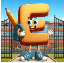
E de école