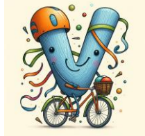
V de vélo