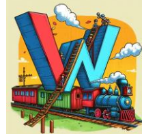
W de wagon