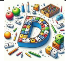
D de domino