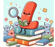
L de livre