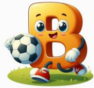
B de ballon