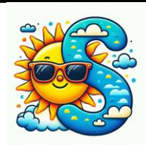
S de soleil