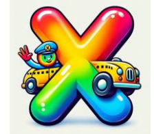
X de taxi