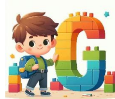
G de garçon