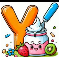
Y de yaourt