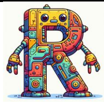
R de robot