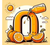
O de orange