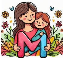
M de maman