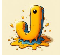
J de jaune