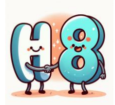
H de huit