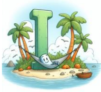
I de île