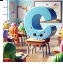
C de classe