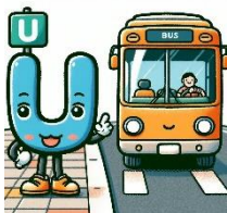
U de bus