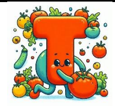
T de tomate