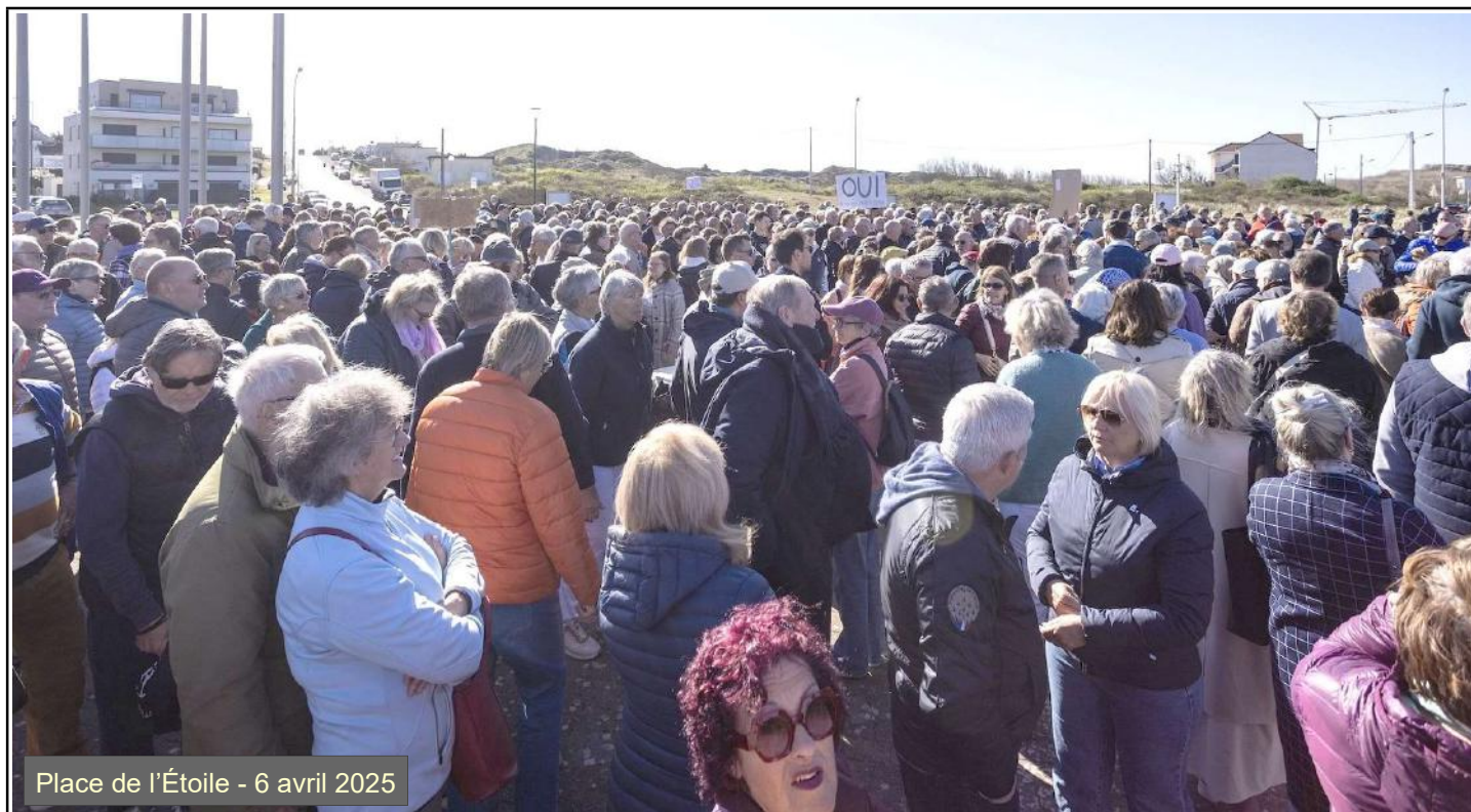
Place de l'Étoile - 6 avril 2025